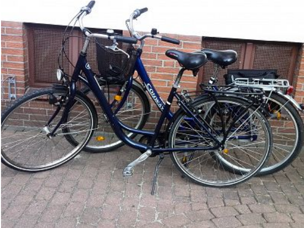
Fahrräder keine Garantie für Funktion